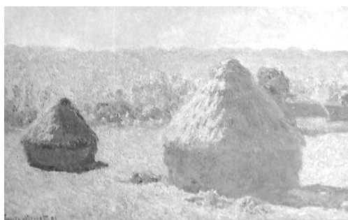
تصویر ۲- کلود مونه، پشته علفه، پایان تابستان، ۱۸۹۰، رنگ‌روغن روی بوم، ۶۰×۱۰۰ سانتی‌متر، موزه لوور، پاریس، ماخذ: (Reyburn, 2004, 116)

گرچه ون‌گوگ، در نقاشی خود، برای بیان احساس اصالت قائل است، لکن، نمی‌توان چنین اندیشید که نقاش منظره‌پردازی که در دل طبیعت لطیف قرار می‌گیرد، تنها با احساسی خام و کور است که به نقش‌آفرینی می‌پردازد. توجه ون‌گوگ و گوگن، به نقاشی و باسمة‌های شرقی، نشان از تمایل آنها به داشتن چیزی بیشتر از احساسات سطحی، در آثارشان دارد. مجموعه آثار، مخصوصاً واپسین کارهای کلود مونه، منجمله، نیلوفرهای آبی‌اش نیز چنین گواهی می‌دهد. مونه بیش از دیگر امپرسیونیست‌ها، روند استحاله واقع‌گرایی تا مرز انتزاع‌گرایی کامل را در روند منطقی امپرسیونیسم، پیش برد.