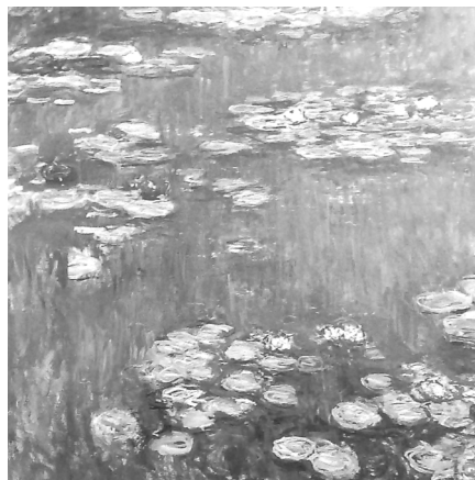
تصویر ۴- کلود مونه، نیلوفرهای آبی، ۱۹۱۶، رنگ روغن روی بوم، ۲۰۰×۲۰۰ سانتی‌متر، موزه ملی هنر غرب، توکیو.

فلوطين (Plotinus) (۲۰۴-۲۷۰ ق.م.)، در باره علت زیبایی چنین می‌گوید: "روح یا جان ما" برحسب طبیعتش به جهان معقول و وجود حقیقی تعلق دارد" پس هرگاه با چیزی روبرو شود که آشنای اوست شادمان می‌شود "و به جنبش می‌آید و به ارتباط خود با آن آگاه می‌شود، و آنگاه به خود باز می‌گردد و ذات خویش و آنچه را که خود دارد به یاد می‌آورد" (احمدی، ۱۳۷۵، ۷۰).