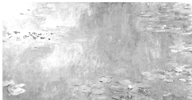
تصویر ۵- کلود مونه، نیلوفرهای آبی، ۱۹۱۷، رنگ روغن روی بوم، ۲۰۰×۱۰۰ سانتی‌متر، موزه هنرهای زیبا، نانت. ماخذ: (Heinrich, 1994, 60)

مبدأ القای هر سروری در منظره‌پردازی، زیبا دیدن کل صحنه با شکوه خلقت خداوند است که هم متعالی و هم حیرت‌انگیز می‌باشد، آن‌چنان‌که، بالاترین وجه اشتراک وردزورث (Wordsworth) و کنستابل (Constable) نیز در این بود که در همه نمودهای خلقت جذبه‌ای باز می‌یافتند. چنان‌که کنستابل می‌گفت: "هرگز در زندگی چیز زشتی ندیده‌ام" (Clark, 1991, 153).