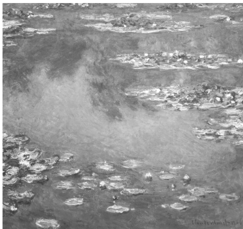
تصویر ۳- کلود مونه، نیلوفرهای آبی، رنگ روغن روی بوم، ۹۲/۶×۸۷/۶ سانتی‌متر. انستیتو هنر شیکاگو، شیکاگو. ماخذ: ( http://www.ibiblio.org/wm/paint/auth/monet/waterlilies )

با مشاهده آثاری همچون نیلوفرهای آبی کلود مونه (تصاویر ۳، ۴ و ۵)، و دریافت مرتبه‌ای دیگر از شهود هنری، این اندیشه در ذهن مخاطب به جنبش درمی‌آید که، اگر فرض شود آن‌گونه که منتقدین و مفسرین هنری اظهار داشته‌اند، توجه و اندیشه و نگرش سطحی و ظاهری به موضوع و جلوه‌های آبی نور و رنگ می‌تواند محرک قوه زیباشناختی هنرمند برای ابداع چنین آثار لطیف و زیبایی باشد، پس نقاش منظرپرداز، با نگاهی بس روحانی‌تر و عمیق نسبت به مشاهده طبیعت و حقیقت آن، در مرتبه‌ای متعالی‌تر از دریافت زیبایی و مشاهده انوار و رنگ‌های غیرقابل توصیف قرار می‌گیرد. نقاش برای یافتن کمال ترکیب‌بندی منظره خود که با صفت عدالت سروکار دارد چگونه از چشمه عدالت، برای رنگ و نور از چشمه نور، برای لطافت از چشمه لطافت، برای دانایی و توانایی از چشمه دانایی و توانایی و برای زیبایی از چشمه زیبایی بهره‌مند خواهد شد. عشق تجلی یافته در طبیعت، وجود هنرمند را مملو از زیبایی می‌کند. زیبایی‌ای که عشق منشاء آن است. زیبایی، صورت عشق است که در ضریب‌ها موزون طبیعت خود را آشکار کرده است.