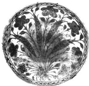
تصویر ۴ - بشقاب زرین فام صفوی. ماخذ: (Fehervari, 2000, fig:351)

زرد مایل به سبز و قرمز مسی نیز وجود داشته است (تصویر ۴). این سفال ها در اشکال متنوعی همچون بطری، کوزه، ابریق، خمره، پایه قلیان، کاسه، بشقاب، گیلان و فنجان تولید می شد که معمولاً بیشتر آنها در ابعاد کوچک ساخته می شدند (Blair & Bloom, 1994, 224). با استناد به سفرنامه ها، به نظر می رسد شهرهای مختلفی از جمله کرمان، شیراز و کاشان در سفرنامه های مختلف به عنوان مراکز تولید این سفال بوده اند، اما تا کنون شواهد و یادداشت های باستان‌شناختی در تأیید این مراکز وجود ندارد (Fehervari, 2000, 289).