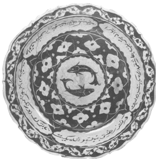
تصویر ۱۰ - بشقاب به دست آمده از آذربایجان. (راجرز، ۱۳۷۴، ۲۶۷)