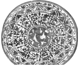
تصویر ۷- ظرف آبی و سفید ساخت کرمان.

مشهد بسیار ظریف و نازک ساخته می‌شدند، و تزیینات آنها بیشتر نقش‌هایی در دو طیف سایه خورده آبی‌رنگ است. شکل این ظروف، شامل دیس‌های بزرگ، بشقاب‌های کوچک، کاسه‌های گود و یا نیم‌کروی است که تقلیدی صرف از ظروف چینی محسوب می‌شوند. (شکل ۶) حتی در تزیینات نیز، یک نوع گرته برداری از مناظر و پیکره‌های چینی و به طور متناوب نمادهای بودایی دیده می‌شود. به طور کلی، طرح‌ها در مجموع شامل چهار کاسه گل با یک طرح گل‌سرخ در وسط است که این طرح ممکن است، برداشتی مستقیم از ظرف‌های چینی باشد. لبه‌های ظروف به دقت به شش ناحیه تقسیم می‌شدند و فضای داخل آنها با نقش‌مایه‌های گیاهی و نمادهای بودایی پر می‌شد و طومارهای برگ‌دار دور تا دور، این نواحی را تزیین می‌کرد (Fehérvári, 1973, 139).