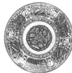
تصویر ۶- ظرف آبی و سفید ساخت مشهد.

از سفال‌های دیگر این دوره نوع آبی و سفید متأخر است، ساخت این سفال برای نخستین بار همزمان با ورود ظروف چینی آبی و سفید، به دنیای اسلام، در نیمه دوم قرن چهاردهم میلادی است. به نظر بسیاری از محققین این سفال، از دوره ایلخانی در ایران رواج پیدا می‌کند، ولی برخی دیگر قدمت ساخت این نوع سفال را قرون اولیه اسلام (قرون سوم و چهارم ه.ق) می‌دانند که نوعی از آن معروف به نقاشی زیر لعاب کبالت و متشکل از لعاب نخودی و نقوش لاجوردی است. این‌گونه ظروف با نقش‌مایه گل‌های چندپر، برگ نخل و گاه کتیبه کوفی، در مراکز صنعتی- هنری نیشابور و شوش ساخته می‌شد. از قرون پنجم و ششم ه.ق نیز نمونه‌های ظروف سفالی با لعاب پاشیده آبی به شکل خطوط آبی بر زمینه لعاب نخودی ساخت ری به جای مانده است. شاید بتوان گفت، توسعه و گسترش ساخت این سفال‌ها در ایران، از دوره ایلخانی و به طور مداوم، در دوره‌های تیموری و صفوی، به تأثیر از نقش‌مایه‌های چینی در مشهد، اصفهان، کاشان و کرمان آغاز شد (روح‌فر، ۱۳۸۱، ۴۸) و در نهایت همزمان با ورود اروپاییان، سفال آبی و سفید در سه شهر مشهد، کرمان و یزد فراگیر شد (Fehervari, 1973, 139). در این میان می‌توان به نقش مهم کمپانی هند شرقی به عنوان رابط تجاری اشاره کرد. چرا که همزمان با واردات ظروف چینی به خاورمیانه، و اروپا، اقدام به صادرات کالاهای ایرانی، از جمله سفال، به شرق آفریقا و حتی اروپا می‌کرد (Crow, 1979-80, 15).