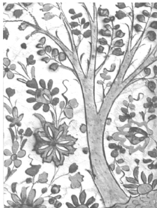
تصویر ۳- طرح روی ظروف کوباچه.

کوباچی (Kubachi)، نام محلی است، در داغستان قفقاز، که احتمالاً محل ساخت این نوع ظروف نبوده و به تعبیر برخی از باستان‌شناسان آنان صنایع فلزی و یا جنگ افزارهای نظامی خود را با ظروف سفالی معاوضه می‌کردند (Lewis, 1976, 54). از این رو برخی معتقدند منطقه ساخت این ظروف جایی در حوالی تبریز بوده است. دیماندر و لین، از جمله محققینی هستند که تبریز را پیشنهاد کرده‌اند (Diamond, 1930, 166) و (Lane, 1939, 35). به‌رحال یک توافق همگانی وجود دارد که "سفال کوباچی" در آغاز قرن هفدهم در شمال غرب ایران ساخته شده است (Fehervari, 1973, 135). البته این موضوع در مورد سایر سفال‌های صفوی نیز صدق می‌کند و به طور کلی به نوعی سفالینه‌های دوره صفوی در آغاز تحت تأثیر منطقه شمال غرب ایران بوده است.