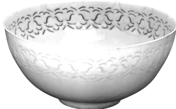
تصویر ۵ - ظرف سفید گمبرون.

سفال گمبرون، که از نام قدیم بندرعباس گرفته شده، از اواخر قرن هفدهم تا میانه قرن نوزدهم میلادی در منطقه بندرعباس ساخته می شد. این سفال که تشابه فراوانی با سفال های سفید دوره سلجوقی دارد، توسط کمپانی انگلیسی و هلندی هند شرقی، از این بندر توسط کشتی به اروپا صادر می شد (Feherevari, 1973, 138). با این حال باید گفت که مکان واقعی این سفال هنوز شناخته شده نیست و نظریات متعددی درباره مراکز تولید این سفال که تاریخ مشخصی هم ندارند، وجود دارد. از جمله این مراکز می توان به شیراز، یزد، کرمان و اصفهان اشاره کرد. تاکنون هیچگونه شواهد باستان‌شناختی در تأیید این نظریات وجود ندارد. این سفال شاید ظریف ترین سفالی باشد که در ایران تولید می شد. سفالی سخت و فشرده که شباهت خیلی نزدیکی به چینی دارد. بعضی از محققین از جمله هابسن ۱ ، معتقدند که شباهت خیلی نزدیک این ظروف، به ظروف چینی، دلیل بر این است که این ظروف واقعاً از چین تأثیر گرفته اند. تا قبل از تولید ظروف چینی که در ناحیه چی ان لونگ ۱۱ در سال های ۹۵-۱۷۳۶ میلادی، ساخته می شد این گونه ظروف در ایران وجود نداشته است (Hobson, 1932, 75). کیفیت این سفال ها ظریف و دارای نقش کنده و گاهی آبی کبالت با تزیینات نقش سیاه زیر لعاب شفاف یا رنگی و یا تزیینات مشبک است (Ibid, 292) (تصویر ۵).