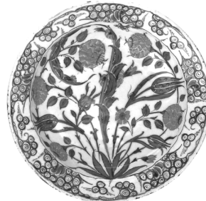
تصویر ۸- ظرف ایزنیک.

سفال ایزنیک در حجم گسترده ای به کشورهای مختلف صادر می شد و گاهی حجم صادرات به حدی بود که خاستگاه این سفال، اشتباه گرفته می شد. به عنوان مثال گاهی این سفال را سفال دمشق، می نامیدند که این ممکن است به دلیل همان صادرات گسترده ای باشد که به سوریه انجام می گرفت. سفال ایزنیک در قرن هفدهم شروع به افول کرد، اما سفالگران آن را کنار نگذاشتند و تا قرن هجدهم به تولید آن ادامه دادند.