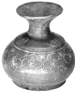
تصویر ۲- ظرف اسپیتون.