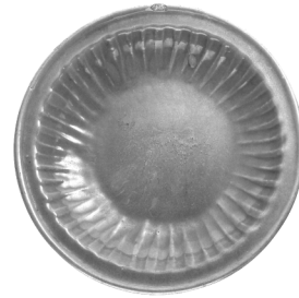
تصویر ۱- ظرف سلادون برداشتی از روی ظروف چینی.