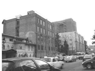
تصویر ۴- بدنه‌ی رها شده‌ی جنوبی خیابان.