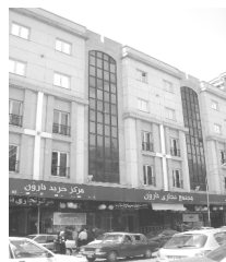
تصویر ۱۰- نمونه تیپولوژی.