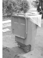
تصویر ۷- سطل زباله.