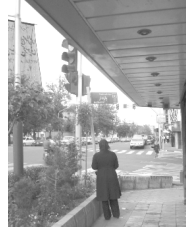
تصویر ۱- پیاده‌رو، راه.