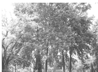
تصویر ۸- مناظر طبیعی میدان پیوسته با پارک.