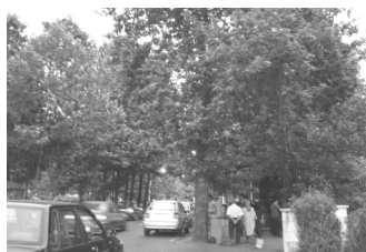
تصویر ۳- گره، میدان نیاوران.