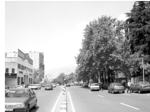
تصویر ۲- خیابان، راه و لبه‌ی سبز درختان.