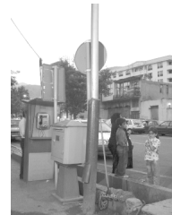
تصویر ۶- تداخل و نا به سامانی مبلمان.