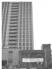
تصویر ۱۱- نمونه تیپولوژی.