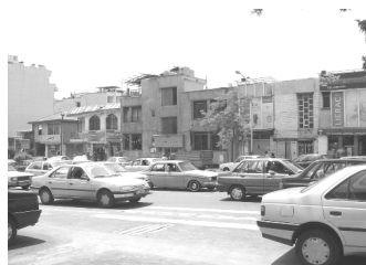
تصویر ۹- بدنه‌ی جنوبی نزدیک به میدان به سامان تر از نقاط دیگر هستند.