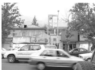
تصویر ۵- نمای ساختمانها و کوه در پیش زمینه.

عامل دیگری که هویت خیابان را تعریف می‌کند منظر بناهای واقع در آن یا "چشم‌های خیابان" است این موضوع هم به مدیران شهری و هم به درک جمعی مردم مربوط می‌شود. و توجه به اینکه سلیقه‌ی فردی بایستی در جهت یک نظم منطقی استوار باشد. علاوه بر اغتشاش ماشین‌ها بی نظمی تابلوهای مغازه‌ها، ساخت و ساز بدون در نظر گرفتن خط آسمان کوه‌ها که میراث و هویت این خیابان هستند و از بین بردن باغ‌های قدیمی و بی‌توجهی به ساختار قدیمی (هویت) این خیابان همگی باعث می‌شوند که از آن تنها به عنوان مسیر عبوری استفاده شود و