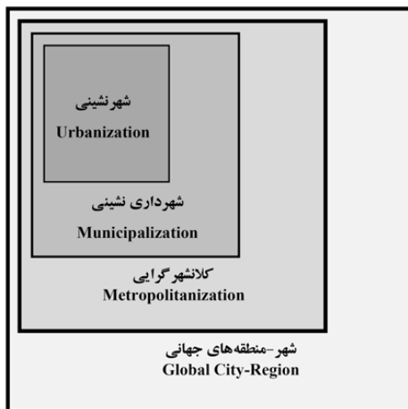
تصویر ۱- تحول ابعاد فضایی و مدیریتی کلانشهرها.

شهرداری گرای اگرچه ظرفیت حکومت‌های محلی را در برخورد با شرایط جدید شهرنشینی افزایش داد اما برای غلبه بر مسائل عمده آن کافی به نظر نمی‌رسید. حکومت‌های محلی و سازمان‌های مدیریت شهر سرانجام از آهنگ رشد شهر عقب ماندند و درحقیقت در مقیاس وسیع آن فرو رفتند. به موازات سرریز رشد شهر در ورای مرزهای حکومت محلی، مقیاس شهر از حدود شهرداری فراتر رفت (ایرانیان، ۱۳۸۵، ۸-۶).