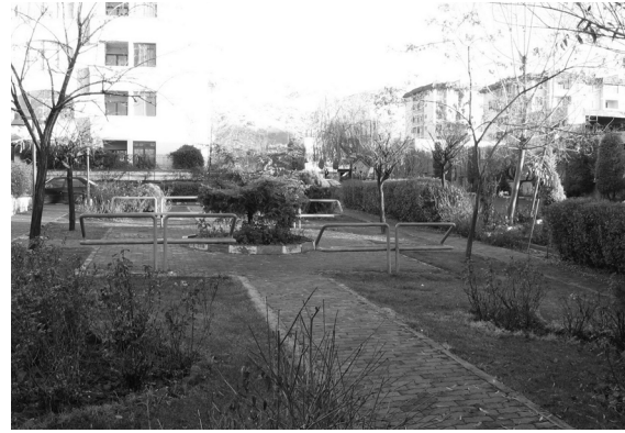
تصویر ۲- فضای باز مجتمع های نور و اسکان در مقایسه با هم.

مقیاس، فرم و خصوصیات ساختمانی، تأثیرات گوناگونی بر محیط از جنبه بصری و سیمای شهری دارند که مهم ترین این اثرات را می توان از نقطه نظر انسداد دید و تأمین چشم انداز، عدم وحدت هماهنگی با زمینه و تأثیرات نما و تزئینات ساختمانها بر منظر شهری بررسی نمود. در این تحقیق، به دو معیار اصلی وحدت فضایی و هماهنگی و منظر و چشم انداز مناسب شهری پرداخته شده است. مجتمع های مسکونی بلند مرتبه در رابطه با دید و چشم انداز کاربردی دوگانه دارند؛ از یک طرف چشم انداز زیبا و افق دید وسیعی را نصیب ساکنان خود می نمایند و از طرف دیگر نه تنها چشم انداز را بر روی ساختمانهای کوتاه اطراف می بندند، بلکه چشم انداز ساختمانهای بلند مجاور خود رانیز مسدود می سازند. بررسی نمونه های موردی نشان می دهد که مجتمع نور به عنوان یک الگوی متعارف، از نقطه نظر منظر شهری باعث برهم خوردگی محلی و خط آسمان مجاور خود نگردیده است و در هماهنگی با ارتفاع و تراکم مناطق اطراف خود قرار دارد. از طرف دیگر، مجتمع اسکان با ارتفاع زیاد خود علاوه بر اشراف کامل و سایه اندازی به ساختمان های کم طبقه اطراف خود، باعث شکستگی ناگهانی خط آسمان محدوده خود گردیده است. لازم به ذکر است مجتمع اسکان به علت قدمت و وزن بصری آن یکی از نشانه های مهم شهر تهران و یکی از نمادهای مسکن مدرن محسوب می گردد.