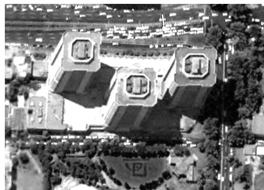
تصویر ۱- تصویر ماهواره‌ای ۳ برج اسکان و ۱۲ بلوک مجتمع تور.

خصوصیات کالبدی- فضایی این دو مجتمع مسکونی در جدول ۱ آمده است.