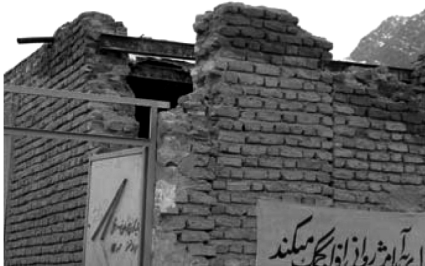
تصویر شماره (۵)