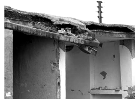
ماخذ: دکتر محمدجواد ثقفی تصویر شماره (۳)