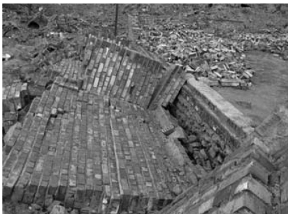
تصویر شماره (۶)