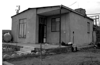
تصویر شماره (۸)

در منطقه مورد مطالعه، موارد نادری از تلاش در جهت اجرای شناژ مشاهده می‌شود ولی شواهد نشان می‌دهد دست اندرکاران ساخت و ساز در منطقه از کیفیت اجرای صحیح شناژ هم اطلاع چندانی نداشته‌اند. در چند مورد مشاهده شده است که برای پر کردن شناژ به جای بتن از آجر و ملات استفاده شده است. در اکثر موارد خاموت‌ها با فواصل بسیار زیاد از یکدیگر و به تعداد خیلی کم اجرا شده‌اند. در برخی موارد، کیفیت بتن استفاده شده در شناژها آنقدر پایین است که با فشار دست خرد می‌شود (تصویر شماره ۷). در شناژها، پوشش بتن که باید میلگردهای شناژ را ببوشاند، خیلی ضعیف و نازک اجرا شده است. شناژها در اکثر موارد اتصال افقی با یکدیگر ندارند. در بعضی موارد بعلت سنگینی بیش از حد دیوار و نیز اتصال ضعیف شناژ در پی یا استفاده از میلگرد ساده، هنگام شکست دیوار، میلگردهای شناژ کاملاً از پی بیرون آمده‌اند.