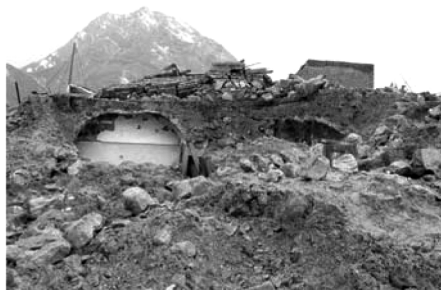
تصویر شماره (۲)

دانست (معماری، ۱۳۷۲، ۳۱). آمار و احتمالات مهندسی نشان می‌دهد به طور متوسط هر چهار سال یکبار در ایران یک زلزله شدید رخ می‌دهد که پیامد آن، تخریب ۹۷٪ واحدهای روستایی و آسیب کلی ۷۹٪ واحدهای شهری در منطقه وقوع زلزله خواهد بود (بیات، ۱۳۸۲، ۳۶-۴۱).