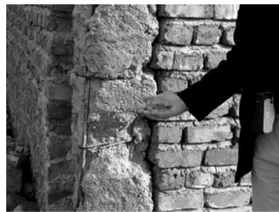
تصویر شماره (۷)

مشاهده گردیده است، در این منطقه نیز به سقف‌های سبک، آسیب جدی وارد نیامده است (تصویر شماره ۴). حتی با وجود تخریب قسمت‌هایی از دیوار، سقف پابرجا مانده است. این موضوع ارزیابی مثبت رفتار سقف‌های سبک و گرایش به این سیستم برای اجرای سقف‌ها را تایید می‌کند. این بدان معنی است که با تکیه بر همان تکنولوژی اجرا شده در این مناطق، می‌توان سیستم‌های سازه‌ای مناسبی اجرا کرد.