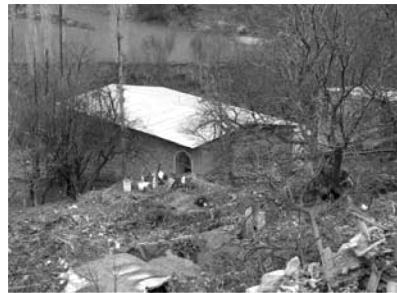
تصویر شماره (۴)