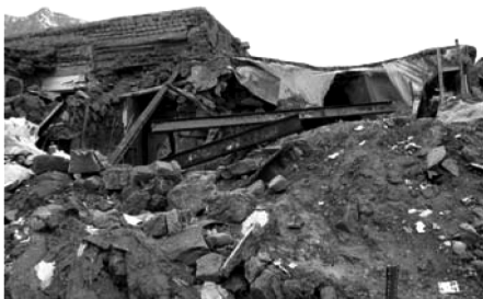
تصویر شماره (۱)

عامل دیگر، افزایش وزن ناشی از اجرای لایه‌های متعدد کاهگل بر روی سقف‌ها می‌باشد که در نهایت موجب افزایش نیروی زلزله و فرو ریختن سقف‌ها شده است (ثقفی، ۱۳۸۵، ۶۷-۷۴). نکته قابل توجه اینست که در منطقه زرد، علاوه بر سقف‌های خشتی ضربی، در سقف‌های متشکل از تیر فلزی و طاق ضربی و حتی سقف‌های سبک هم از کاهگل برای پوشش استفاده شده است. در مواردی، به جای کاهگل از یک لایه ضخیم آسفالت استفاده شده است که بار مرده نسبتاً زیادی بر سقف تحمیل می‌کند (تصویر شماره ۳). نکته قابل توجه آن است که مردم حاضر به صرف مخارج نسبتاً بالا برای مقاوم ساختن سرپناه خود هستند ولی در بسیاری موارد دانش و تکنولوژی صحیح آن را در اختیار ندارند. همچنان که در مناطق زلزله زده پیشین نیز