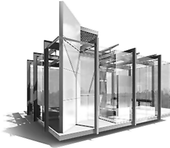
تصویر ۳- نمایی از نانو خانه