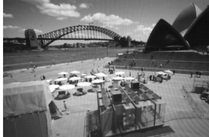
تصویر ۲- نانو خانه در استرالیا در سایت سالن اپرای سیدنی