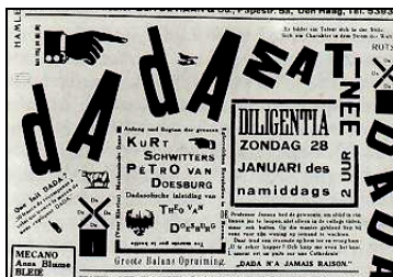
تصویر ۴- پوستر برای نمایشگاه دادا، شوایترز، و واندو سبرگ، (۱۹۲۳)