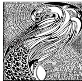
(تصویر ۱۲- وس ویلسون، ۱۹۷۶)

مثال آن پوستر وس ویلسون ۳۱ بنام پرند در آتش است که، پرند ای در پرسپکتیو را نشان می دهد که از حروف منحنی شکل، تکرار نام یک گروه شکل گرفته است. در واقع نوشته در تصویر ناپدید شده است و در عین حال، آن تصویر را باز تاب می دهد (شکل ۱۲).