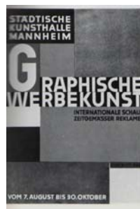
(تصویر ۹ - هربرت بایر، طراحی جلد (تصویر ۱۰ - جان چیکولد، ۱۹۲۷)

پوسترهای یو گند استایل (سبک جوان) آلمانی، که بخاطر تحول جدیدو هنر مندانه سبک عجیب طراحی آن در گالری هنر دانشگاه برکلی کالیفرنیا نگهداری می شود، در دهه ۱۹۶۰ مورد توجه مخصوص طراحان قرار گرفت. پوستر هیپی با فرم غریب طراحی آن، بسیار مدیون طراحان سبک آرت نوو و طراحان سمبولیست اواخر قرن نوزدهم می باشد (BARNICOAT, 1972,57).