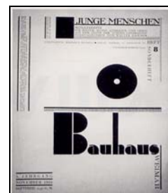
برای کتاب باو هاوس)