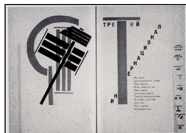
( تصویر ۶ ال لیسیتزکی- برای کتاب مایا کوفسکی )

نمونه دیگر استفاده از نوشتار در نقاشی در جهت نشان دادن اهداف هنری پاپ آرت، منظور گشت. در اثری از ریچارد همپلتون ۱۰ بنام "چه چیزی