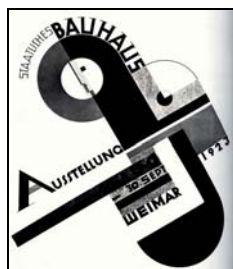
(تصویر ۷- پوستر برای نمایشگاه