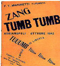
تصویر ۳- ماری نیتی، زنگ، تمب، تمب (۱۹۱۲)

با این همه هر دو جنبش در آثار خود از عبارات تصویری هرج و مرج طلبانه تایپوگرافی استفاده کردند. مثال آن پوستری است که توسط کورت شوایترز ۳ و وان دوسبرگ ۴ برای "ریستال دادا در هاگو" ۱۹۲۳ (شکل ۴) طراحی شد. در این اثر شاهد هرج و مرج در ترکیب بندی تایپوگرافی کلمه دادا ۵ به صورت های تایپی متفاوت (در بالا و در پایین) هستیم.