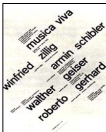
(تصویر ۸- پوستر نوشتاری، مولر بروکمان، ۱۹۶۰)

اشکال تاییبی با اتکا به گرید و بدون سریف در آمریکا شناخته شد و بسیار بکار رفت. پوسترهای نوشتاری باهاوس و تایپوگرافی جدید (تصاویر ۷ الی ۱۰) نشان می دهد که فرم، اندازه، رنگ و ترکیب عناصر نوشتاری (حروف مجزا یا کلمات نوشته شده و علائم)، باعث ایجاد تماس بصری قوی می شود، که در آن حروف جایگاه تصویر و موضوع را در پوستر می یابد. این موضوع مبدل به یک مباحثه جدی در رشته طراحی گرافیک شد که از طریق طراحی باهاوس آغاز و در میان طراحان سوئیس تکامل یافت.