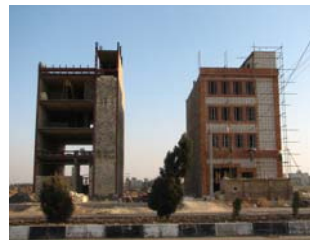
تصویر شماره ۴: جداره در حال شکل گیری بزرگراه عمار یاسر، قم

در جدول شماره ۱، دو طرح نواب و عمار یاسر بر اساس دو دسته معیارهای محتوایی و رویه ای مورد ارزیابی و مقایسه قرار گرفته اند. معیارهای محتوایی که کیفیت پروژه نهایی را مد نظر قرار می دهند عبارتند از: توجه به زمینه، انعطاف پذیری، هویت، توجه به طبیعت، آثار زیست محیطی، مقیاس انسانی و کیفیات بصری، توجه به قلمروهای عمومی و ایجاد فضاهای غیر قابل دفاع. بررسی انجام شده نشان می دهد که پروژه نواب در کلیه موارد فوق دارای امتیاز منفی بوده و بنابراین پروژه مذکور نسبت به ارزش های اساسی طراحی شهری بی اعتنا بوده است. در حالی که در طراحی پروژه عمار یاسر سعی شده طرح به گونه ای شکل پیدا کند که ویژگی های فوق حتی المقدور در