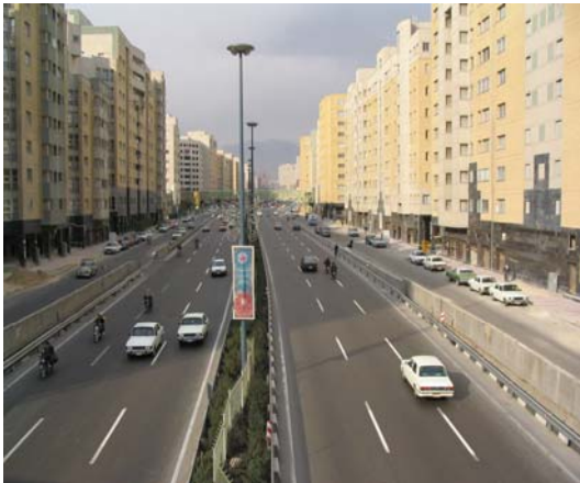
تصویر شماره ۳: بزرگراه نواب و جداره های آن، تهران

جهت هماهنگی نماها و نیز نوع کاربری ها همجوار. که توصیه مشاور شیوه اول یا تجمیع قطعات بوده است. به همین دلیل راه هایی جهت ترغیب و تشویق مالکین جهت تجمیع قطعات پیشنهاد گردیده است. همچنین جهت هدایت توسعه در جهت تحقق اهداف