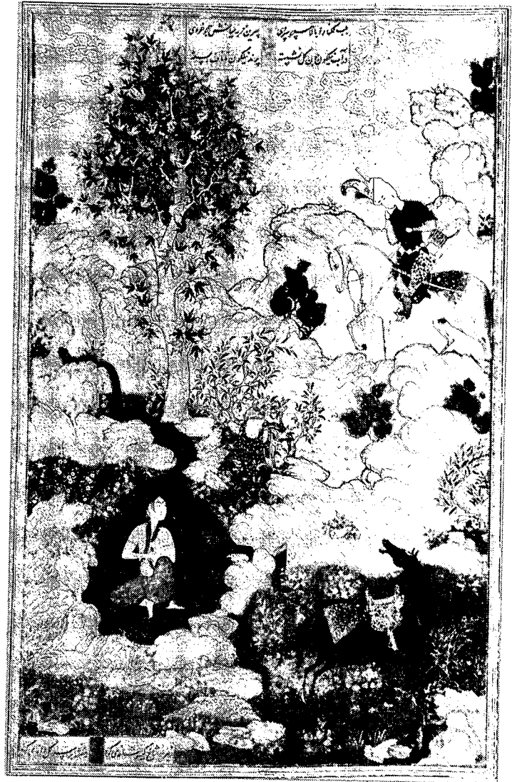
نخستین دیدار خسرو و شیرین، مکتب تبریز

نظامی درباره خسرو و گشت و گذار او، طبیعت را تفسیر می‌کند: