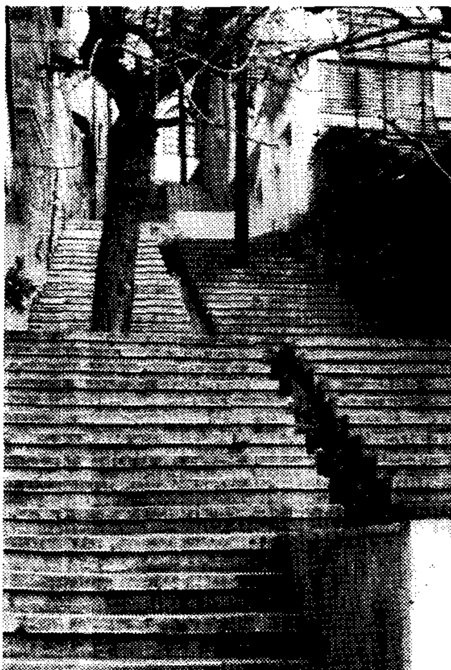
شکل ۶- گذرهای پله ای یکی از مشخصات بافت محله امامزاده قاسم است که به دلیل شرایط خاص توپوگرافیک در بخش های مختلف محله به چشم می خورد. به جهت ضوابط گذرندهی وضع موجود کلیه گذرهای پله ای پذیرفته شده و فرآیند شهرسازی در همین جا متوقف می شود.

گذرهایی که در سطح بافت وضع موجودشان پذیرفته و تثبیت شده است، بیشتر گذرهای پله ای است. طبق ضوابط شهرداری از آنجایی که گذرهای پله ای مختص رفت و آمد افراد پیاده بوده و به عبارت بهتر نمی تواند "ماشین رو" باشد، معمولاً با عرض موجود در محل، ملاک عمل قرار می گیرد. به این ترتیب این گذرها عملاً از گردونه برنامه ریزی حذف می شود و پذیرفتن وضع موجود آنها، که در آن صرفاً عرض معبر مدنظر قرار دارد، بارها کردن آنها به حال خود مترادف می گردد (شکل ۶). گرچه که وضع موجود این گذرها به عنوان اجزای بافت ارگانیک