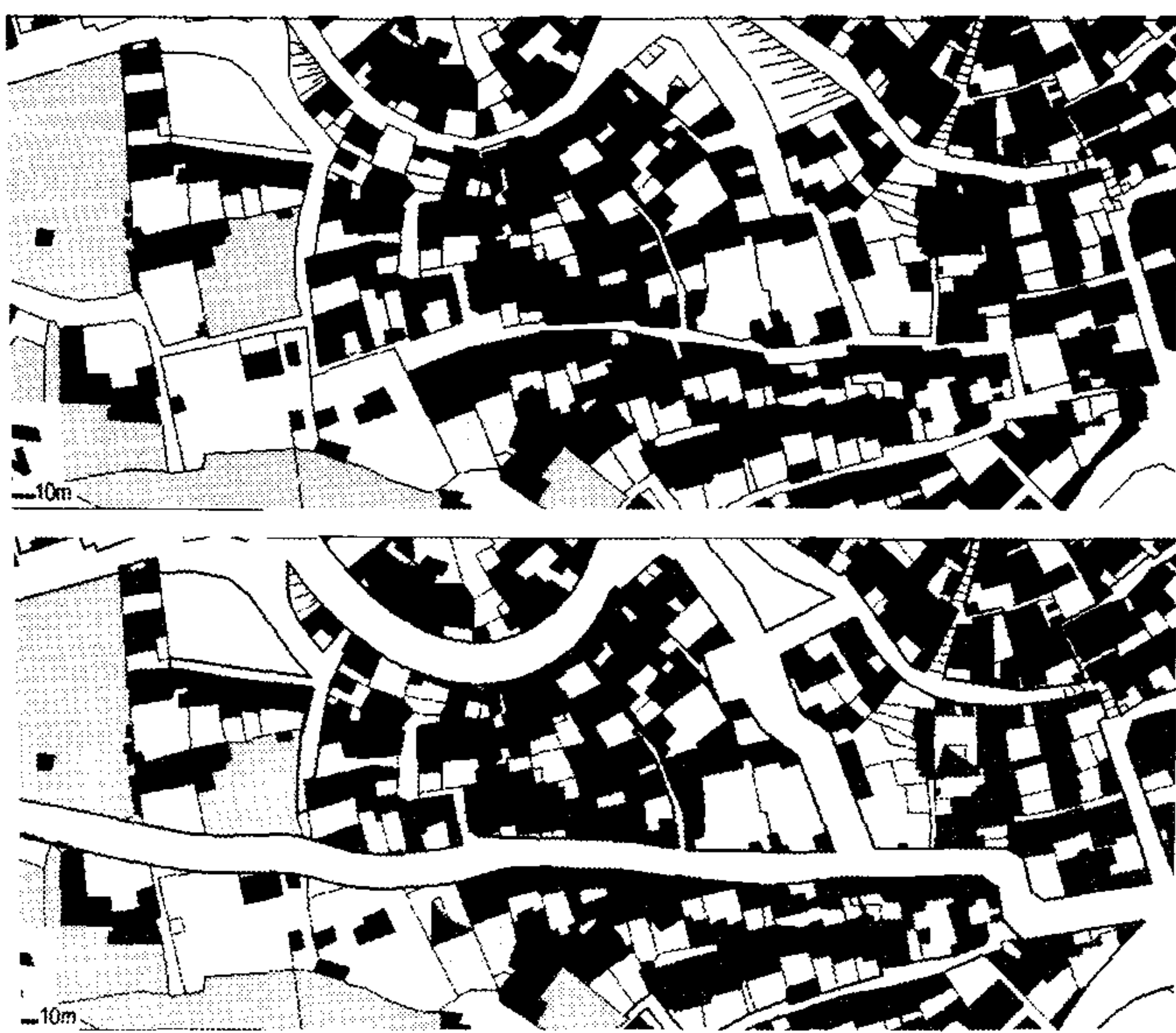
شکل ۴. تعریض پیشنهادی طرح تفصیلی برای کوچه قادری که از گذرهای اصلی و دارای هویتی تاریخی است، با تخریب فراوانی همراه است.