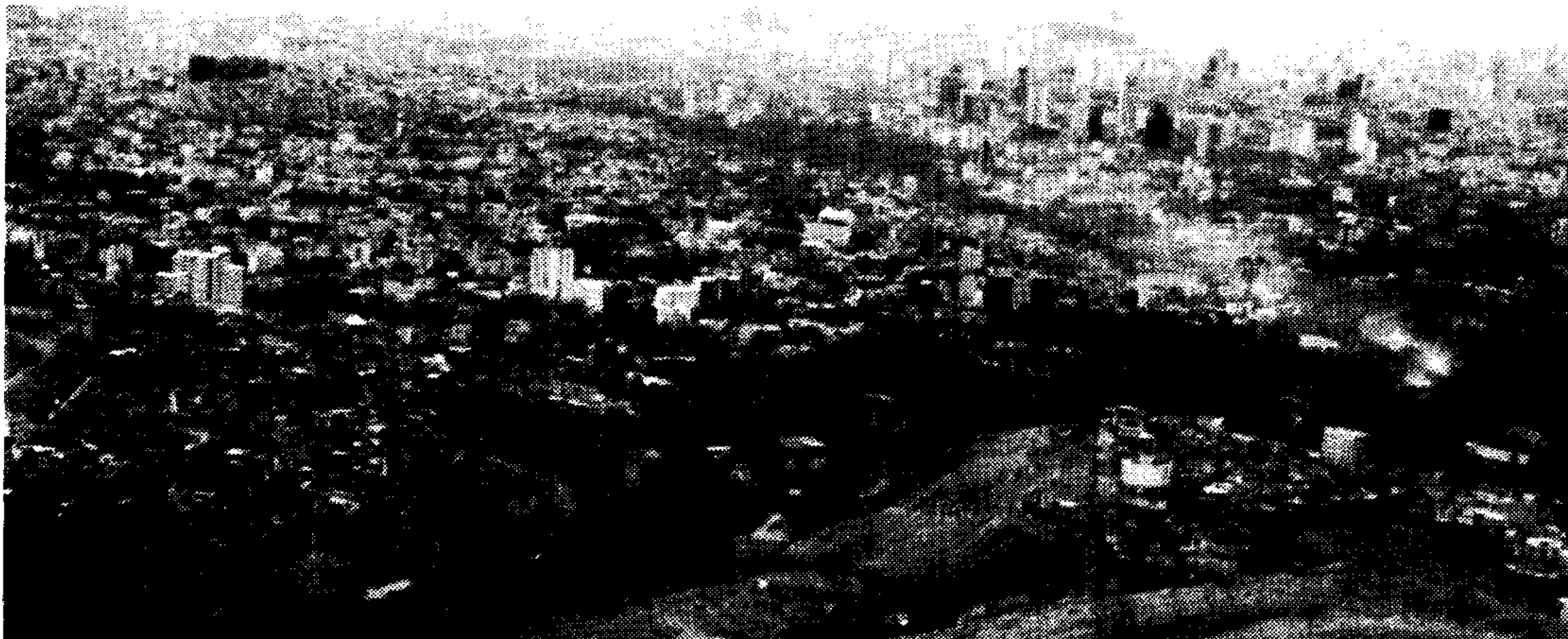
شکل ۲. منظره محله امامزاده قاسم و ارتباط فضایی آن با گلاب دره و محله های شمیران (محله امامزاده قاسم در گوشه چپ پایین تصویر)

۱- برای برخی از معابر و گذرهای اصلی طرح هندسی و عرض های متداول در طرح های تفصیلی رایج در نظر گرفته شده است و بعبارت دیگر رویکرد تعریض گذرها و تبدیل کردن آنها به معابر هندسی وجود دارد.