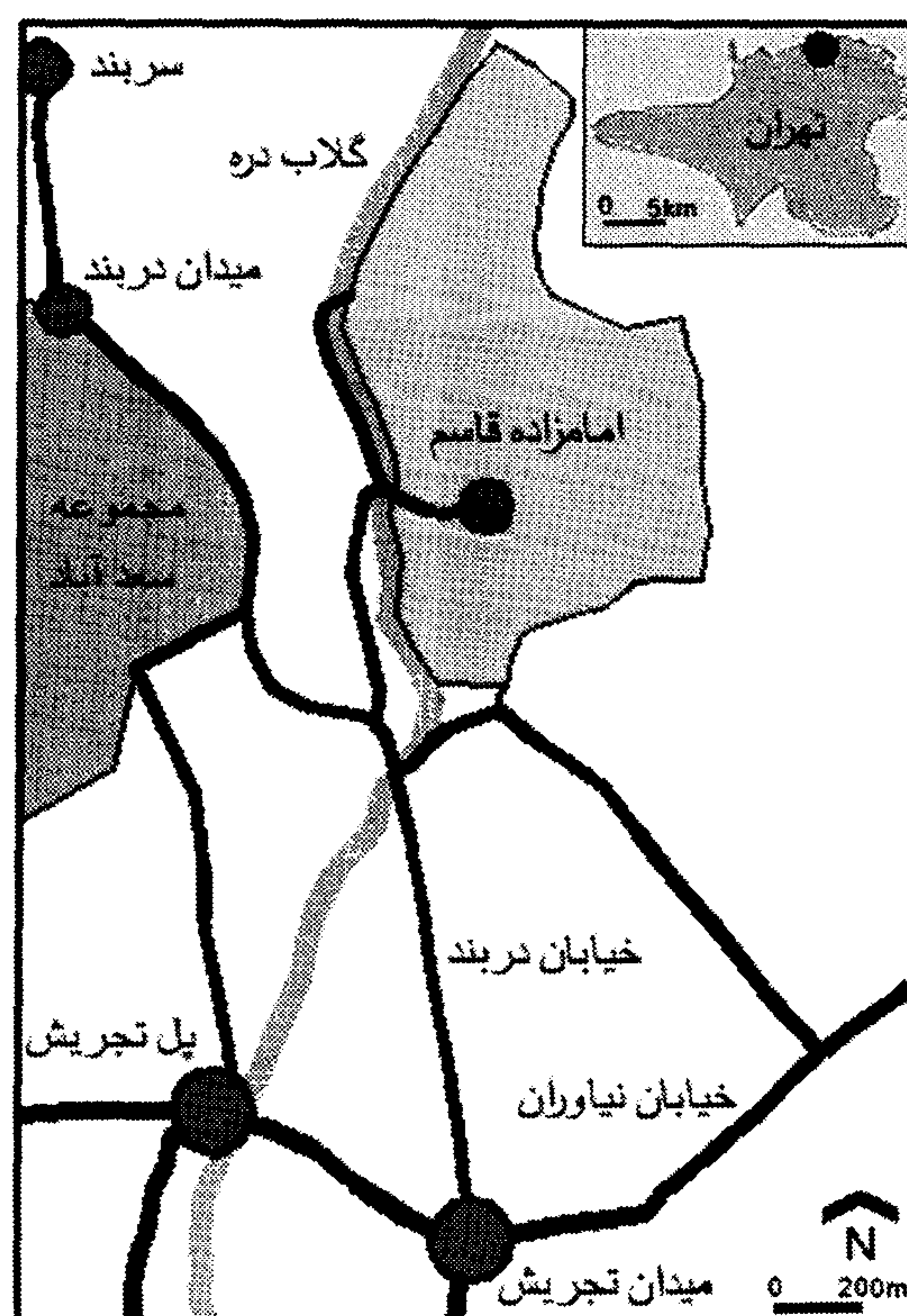
شکل ۱- پلان موقعیت محله امامزاده قاسم

از آنجایی که مشخصات طرحی مثل طرح جامع اول تهران، ایجاب نمی کرد که برای چنین بافت هایی برنامه ای مناسب در نظر گرفته شود و از طرفی این محله به عنوان یک فضای زیارتی - تفرجگاهی بدون برنامه ای خاص شناخته شده، نمی توان آن را مکانی برنامه ریزی شده دانست؛ بلکه فقط از آن در یک کلیت همه شمول نام برده شده است و همان طور که در مقررات اصلاح طرح جامع تهران آمده "به شهرداری اجازه داده