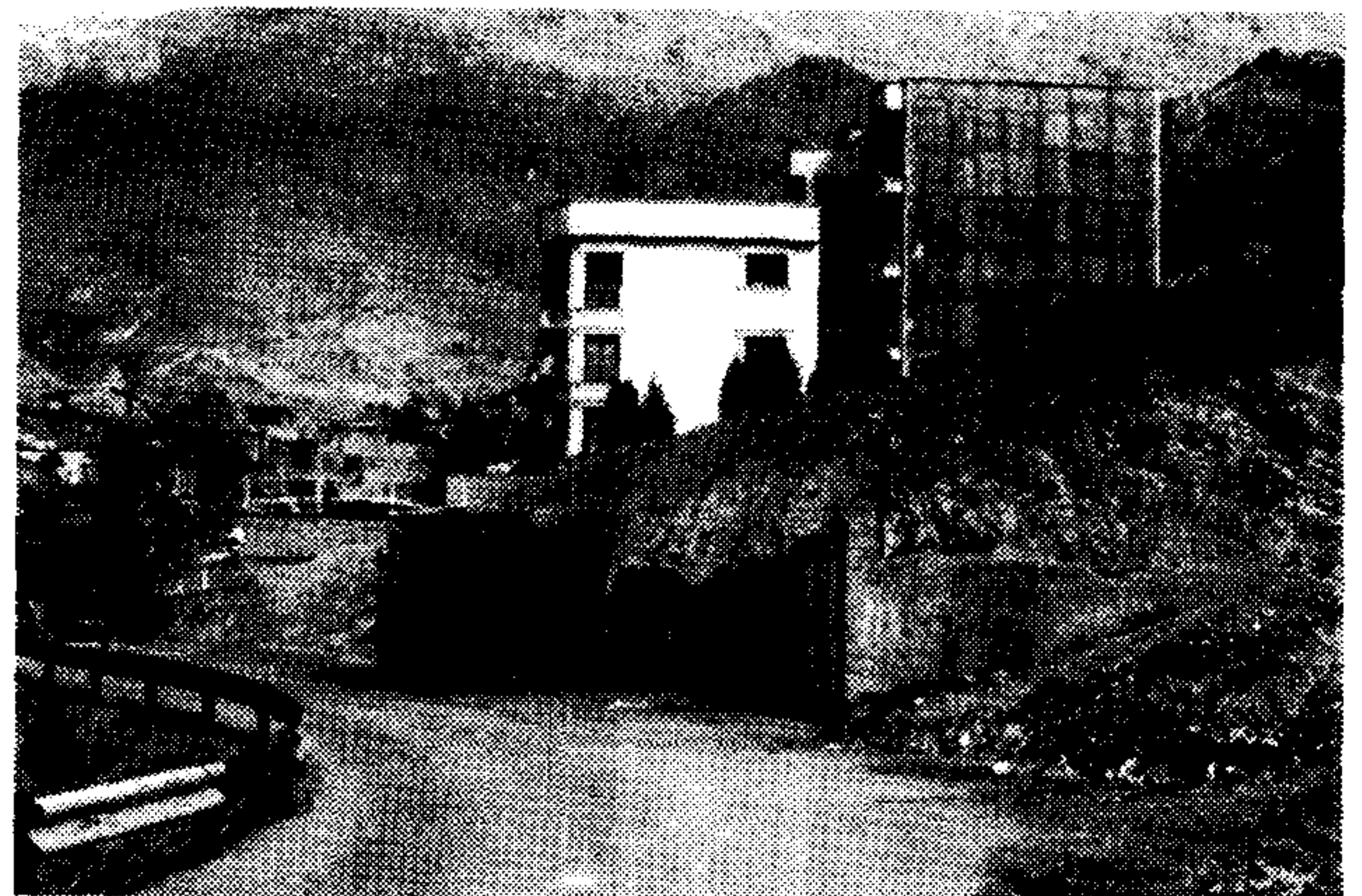
شکل ۳- در جریان ساخت و سازهای صورت گرفته در بخش الحاقی برخی از بناها بالاتر از خط ۱۸۰۰ متر احداث شده اند.

را به جهت برخورداری از طرح شهری، کلاً بلا تکلیف دانست. گرچه به جهت استخوانبندی کلی این قسمت دارای بافت ارگانیک است ولی به لحاظ نوع ساخت و ساز انجام شده، مداخله های صورت گرفته و کیفیت فیزیکی و بصری وضع موجود، نمی توان آن را یک بافت قدیمی و یا واجد ارزش تاریخی نامید.